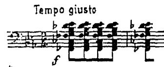
أحد التآلفات « الطرية » وهو متعدد المقامات من باليه « قربان الربيع » .

والأسلوب الموسيقي الذي كتب به سترافنسكي موسيقى هذا الباليه التاريخي ، الذي أصبح الآن من عيون كلاسيكيات القرن العشرين ، أسلوب كان عندئذ شديد الغرابة والجددة فهو يعتمد على أفكار موسيقية قصيرة محدودة النغمات يداؤها ويكررها كثيراً مع إعادة ترتيب مكوناتها بالتكرار أو المحاكاة - imitation بايقاعات غير رتيبة ولا منتظمة النبرات ، وتتغير الأزمنة الموسيقية بسرعة كبيرة طوال الموسيقى تغييراً لم تعهده الموسيقى من قبل مثال 3,16 2,16 3,16 2,8 2,16 . وهذه الضغوط الإيقاعية الحادة غير المنطقية تضفي على الموسيقى توتراً حاداً مثيراً ، ويزيد من حدة الخشونة أن المؤلف استخدم عدة تآلفات هارمونية بأسلوب طرقي « إيقاعي Percussive ، واستخدم تآلفات متعددة المقامات » نموذج رقم ٢ تصدم الأذن بمجموعات أو « عناقيد » من الأنغام تجمع بينها انصاف أصوات ذات وقع شديد الخشونة وخاصة على الأذن المعتادة على سماع التآلفات الكلاسيكية أو الرومانتيكية . وجاء هذا الاتجاه الجديد ، استجابة